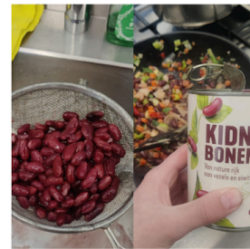
Bonen toevoegen aan de groente en bakken