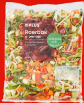
Groente Italiaanse stijl geen ui 400 gram