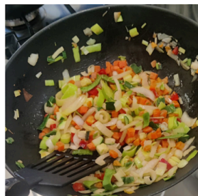
Groente bakken 3-10 minuten