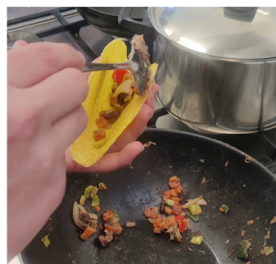
Groente en bonen in de taco's doen